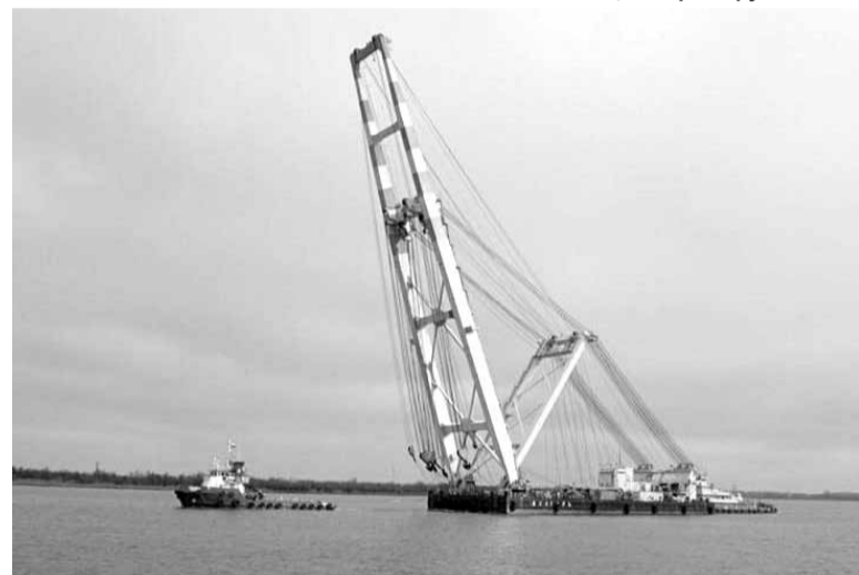
Плавкран «Волгарь» – изобретение астраханских инженеров