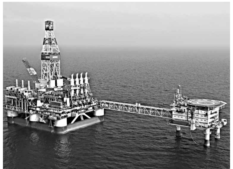
Перспективы Группы «Каспийская Энергия» остаются прежними — это предстоящие проекты по освоению шельфа Каспия, особенно его российской части.