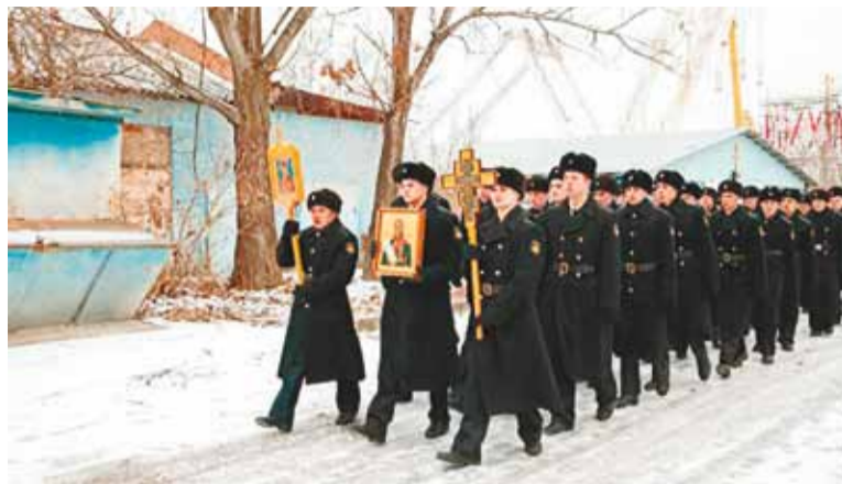
Моряки Каспийской флотилии – достойные продолжатели подвигов легендарного адмирала Ушакова