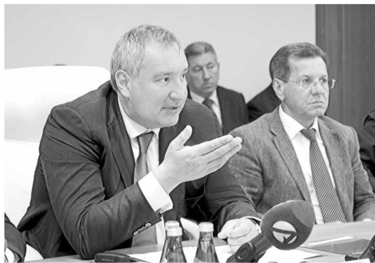
В сентябре прошлого года в присутствии заместителя председателя Правительства РФ Дмитрия Рогозина был подписан протокол о намерениях на строительство 10 барже-буксирных составов между ОАО «СОВФРАХТ» и ООО «КНРГ Управление»