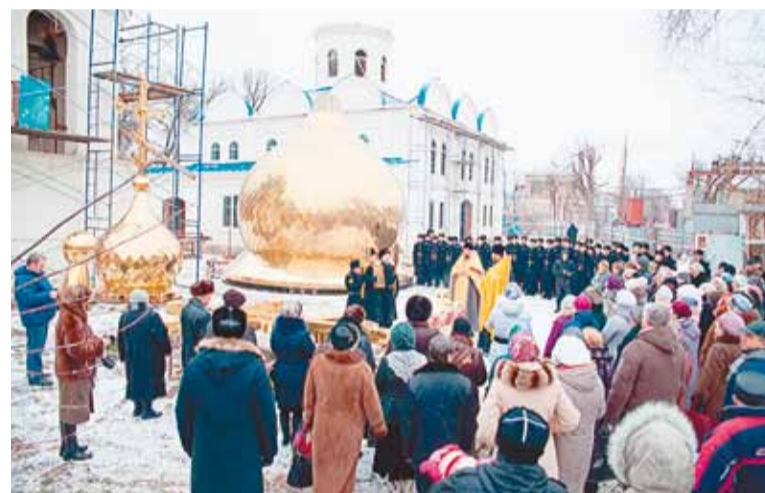
На великое событие пришли жители близлежащего микрорайона